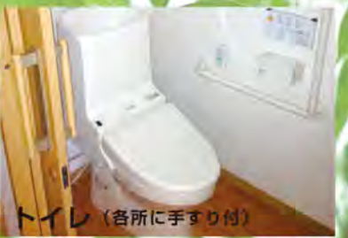
トイレ (各所に手すり付)