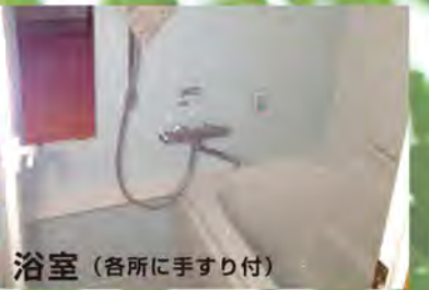
浴室 (各所に手すり付)